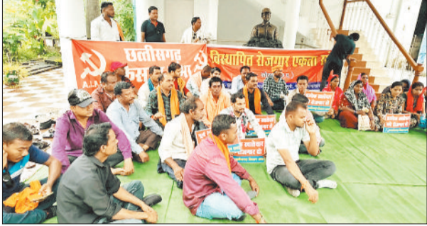
धरना देते भूविस्थापित।