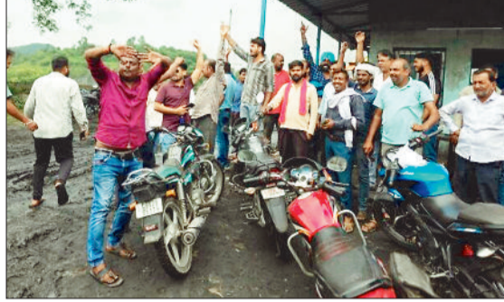
मानिकपुर व कुसमुंडा खदान में प्रदर्शन करते हुए ट्रक व ट्रेलर मालिक संघ के सदस्य।

भाड़ा वृद्धि की मांग को लेकर ट्रक ट्रेलर मालिक सेवा समिति ने कामबंद हड़ताल शुरू कर दिया है। आंदोलन के पहले दिन मानिकपुर व कुसमुंडा में संघ के पदाधिकारियों ने मोर्चा संभाला। दोनों खदानों में हड़ताल की वजह से ट्रकों व