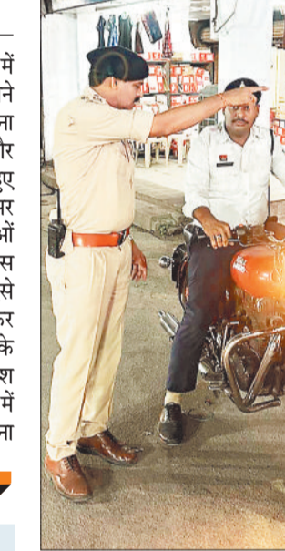
कार्रवाई करती पुलिस।

शहर में मोटरसाइकिल बुलेट में मॉडिफाइड साइलेंसर लगाकर घूमने व पटाखे की आवाज निकालना लोग अपनी शान समझते हैं और लगातार शहर में फरटि मारते हुए घूमते हैं। ऐसे मॉडिफाइड साइलेंसर लगाकर घूमने वाले बुलेट राजाओं के खिलाफ यातायात पुलिस एक्शन में आ चुकी है और अब ऐसे मॉडिफाइड साइलेंसर लगाकर घूमने वाले चालकों को अब मौके पर नहीं बल्कि सीधे न्यायालय पेश किया जा रहा है जिन्हें न्यायालय में सीधे 15-15 हजार रुपए का जुर्माना