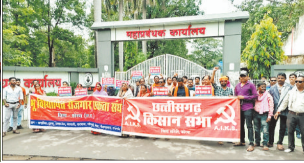
मेन गेट में प्रदर्शन करते भूविस्थापित।