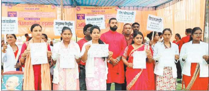
मुख्यमंत्री के नाम लिखे पत्र के साथ एनएचएम स्वास्थ्य कर्मी।

जिले के एनएचएम कर्मचारी पिछले तीन दिनों से अपनी विभिन्न मांगों को लेकर जिला मुख्यालय पर धरना-प्रदर्शन कर रहे हैं। इन मांगों में प्रमुख रूप से नियमितकरण, वेतन विसंगतियों को दूर करना, संविदा कर्मचारियों को स्थायी कर्मचारियों के समान सुविधाएं देना और