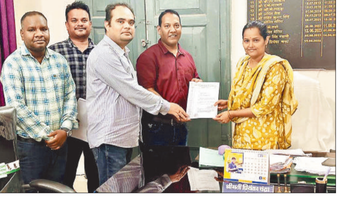
तहसीलदार को ज्ञापन सौंपते हुए राजस्व निरीक्षक।

संसाधनों की मांग को लेकर पटवारियों और राजस्व निरीक्षकों ने ऑनलाइन कार्य का बहिष्कार कर राजस्व विभाग के सभी वह कार्य ठप हो गए हैं जो ऑनलाइन प्रक्रिया के तहत किए जा रहे थे। इस कार्य में नामांतरण से लेकर रिकार्ड दुरुस्तीकरण, फौती बटवारा व रजिस्ट्री जैसे कार्य शामिल हैं। बीते तीन दिन से दोनों कर्मचारी वर्गों द्वारा ऑनलाइन कार्य का बहिष्कार