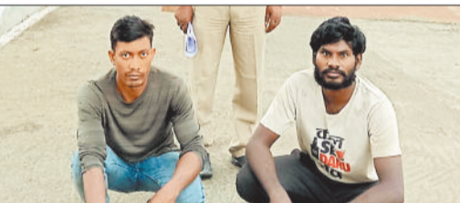
पुलिस गिरफ्त में आरोपी।

आबकारी विभाग की टीम लगातार अवैध शराब के खिलाफ मुहौम चला रही है। बुधवार को 4 अलग अलग स्थानों में छापा मारी की कार्यवाही कर कुल 74 लीटर महुआ शराब व 130 किलो महुआ लाहन जप्त किया गया है। मामले में आबकारी अधिनियम के तहत कार्यवाही की गई है।