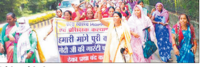
रैली निकालती मितानिन।

इसके पूर्व छत्तीसगढ़ की स्वास्थ्य सेवाओं की रीढ़ माने जाने वाले मितानिन आशा व संबंधित कर्मचारी विगत माह 29 जुलाई को एकदिवसीय प्रदेश स्तरीय धरना प्रदर्शन के द्वारा तृता रायपुर में मुख्यमंत्री विष्णुदेव साय को ज्ञापन सौंपा जिसमें संगठन द्वारा उचित निराकरण हेतु 8 दिनों का पर्याप्त समय दिया गया। प्रदेश